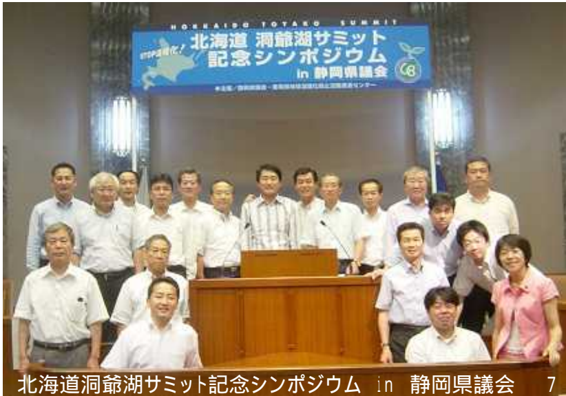
北海道洞爺湖サミット記念シンポジウム in 静岡県議会 7

先日行われた北海道洞爺湖サミットにさきがけ、7月4日に本会議場で県議会各会派の代表と市町議会議員13名が地球温暖化防止に関する取り組み事例の紹介や自分の主張を述べる「スピーチセッション」が行われ、静岡から地球温暖化防止のアピールを行いました。